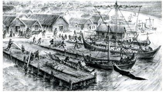
Haven van Dorestad

Een clubje Zuid-Franse monniken probeert zieltjes te winnen in Brabant.