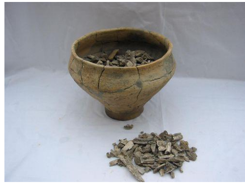
Urn met menselijke overblijfselen van rond 600

Waardoor weten we zo weinig weten over wat er in deze tijd in de Lage Landen gebeurde?