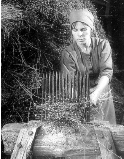
Hekel: instrument om vlas van zaaddozen te ontdoen.