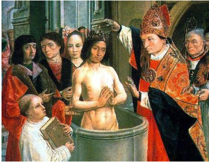
Doop van Clovis, koning van de Franken

De Friezen hebben een probleem. Ze wonen weliswaar hoog en droog op zelf opgeworpen terpen, maar het omliggende land is niet geschikt voor het verbouwen van graan. Waarom zal duidelijk zijn, maar welke oplossing hebben de Friezen?