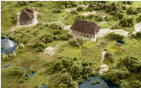
Dorp in het Noord-Hollandse duingebied

Ten zuiden van de grote rivieren wonen de Franken. Hun koning heet Clovis. Hij verovert het ene gebied na het andere. Om politieke redenen vindt hij het slim zich te laten dopen. Wat betekent dat voor zijn onderdanen? En hoe probeert Clovis zich bij de inwoners van Tours (stad in het huidige Frankrijk) populair te maken?