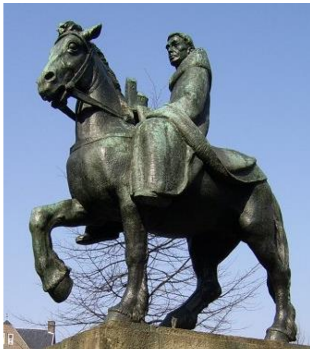
658-N1 Bekend Het geboortjaar van deze man. Zijn wieg staat in Engeland, zijn standbeeld in Utrecht. Rara hoe zit dat?