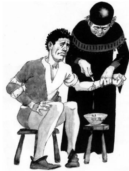
647-E1 Komt een man bij de dokter... De gezondheidszorg staat nog in de kinderschoenen!