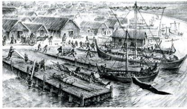
Haven van Dorestad