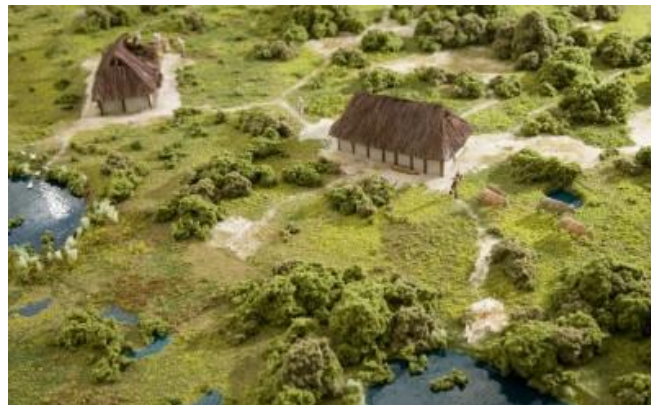
Dorp in het Noord-Hollandse duingebied

Ten zuiden van de grote rivieren wonen de Franken. Hun koning heet Clovis. Hij verovert het ene gebied na het andere. Om politieke redenen vindt hij het slim zich te laten dopen. Wat betekent dat voor zijn onderdanen? En hoe probeert Clovis zich bij de inwoners van Tours (stad in het huidige Frankrijk) populair te maken?