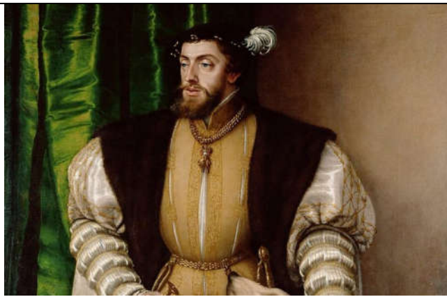
Karel V (1500-1558), koning van Spanje, Heer der Nederlanden en keizer van Duitsland