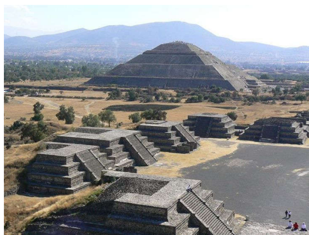
Pyramides van Teotihuacan (Mexico)