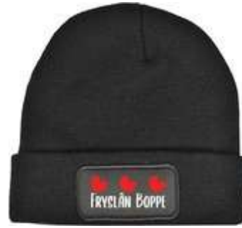
Fryslân boppe, leve Friesland! (afbeelding Bol.com)

Verskil en overeenkomst met de waterlinie die we later zelf aanlegden?