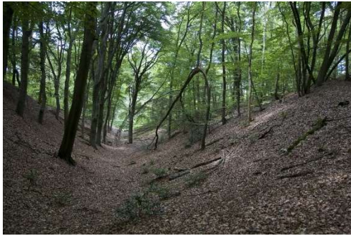
Louisedal bij Berg en Dal, deel van een Romeins aquaduct .

Jaarpaal 90, kubuszijden N1 en N2 Primeur: eerste waterleiding in ons land.