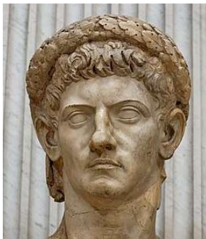
Keizer Claudius (Wikipedia)

Hoog bezoek maar met een sneu resultaat.