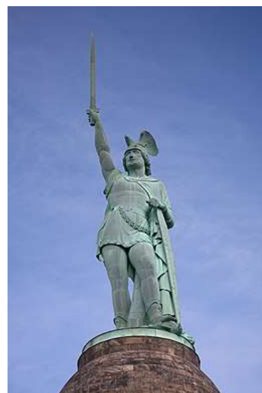
Germaanse aanvoerder Arminius Standbeeld in het Teutenerwald (DL)

Welke informatie vind je het meest opmerkelijk?