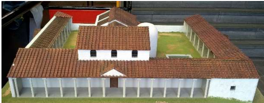
Model van Romeins badhuis in Heerlen

Jaarpaal 90, kubuszijden N1 en N2 Primeur: eerste waterleiding in ons land.