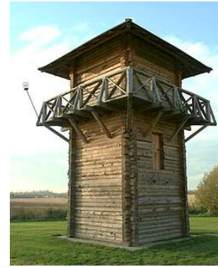
Reconstructie van een Romeinse wachttoren bij fort Fectio

Jaarpaal 127, kubuszijde N Ooit was Vleuten belangrijker dan Utrecht.