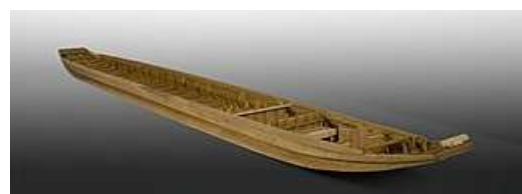
Model van Romeins schip dat bij De Meern (U) is opgegraven (Museum Castellum Hoge Woerd)

Romeinse legioenen bleken niet onoverwinnelijk. Dat geldt ook voor machtige legers in onze tijd. Waar denk je aan?