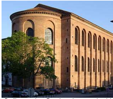
Basilica: openbaar Romeins gebouw voor handel en rechtspraak

Verskil en overeenkomst met de waterlinie die we later zelf aanlegden?