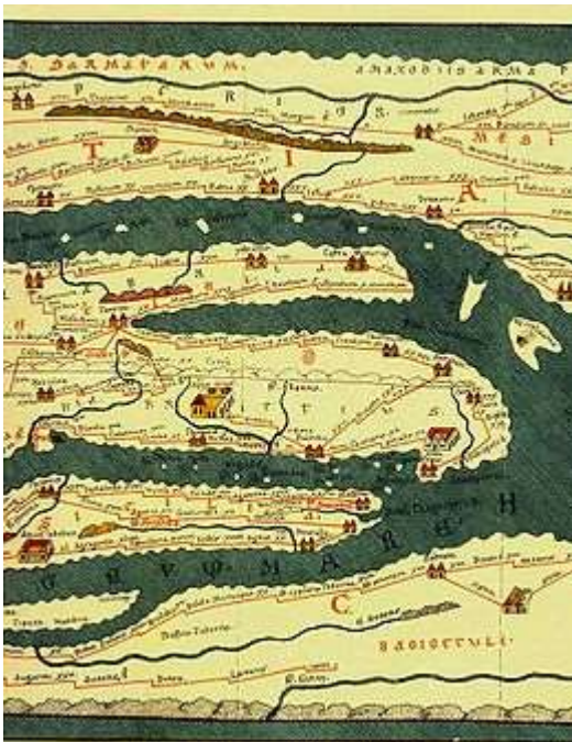
Fragment van Peutinger wegenkaart uit Romeinse tijd

Jaarpaal 102, kubuszijden N1 en N2 Surprise! Badplaats Nijmegen.