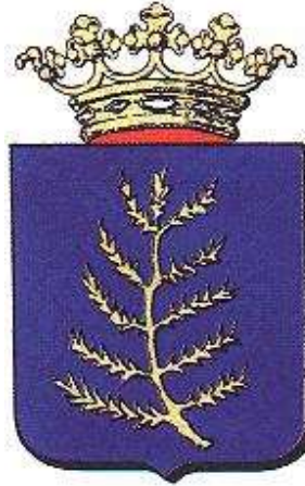
Stadswapen van Rijssen.

Graaf Otto III was bisschop van Utrecht. Hij verleende op 5 mei 1243 stadsrechten aan Rijssen. Daarmee bezorgde hij zichzelf, als hij van Utrecht naar bijvoorbeeld Oldenzaal reisde, een veilige verblijfplaats omdat Rijssen in die tijd omringd was door moerassen.