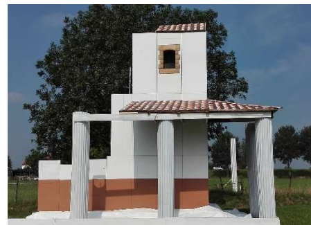
Model van Romeinse tempel in Empel (Christomartens, afbeelding Wikipedia)

Jaarpaal 127, kubuszijde N Ooit was Vleuten belangrijker dan Utrecht.