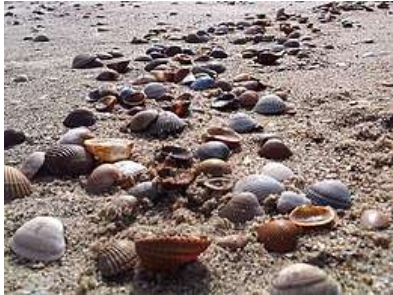
Voor het oprapen...

De Romeinen introduceren hier een nieuw type bouw.