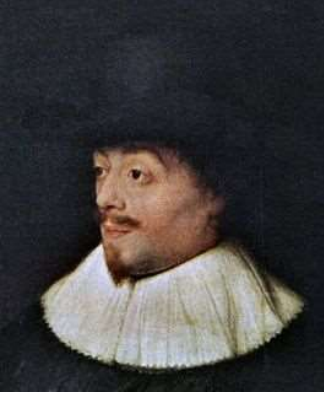
(Portret door Jan Lievens (1627-1630).

Vernoemd naar Constantijn Huygens (1596-1687), een van de grootste Nederlandse dichters uit de Gouden Eeuw, diplomaat, secretaris van o.a. Frederik Hendrik, geleerde, componist, architect en talenwonder. Met andere woorden: een alleskunner. Vader van staatsman en natuurkundige Constantijn Huygens jr. en van de geniale natuur- en wiskundige Christiaan Huygens. Naamgever van de Constantijn Huygensprijs voor literatuur.