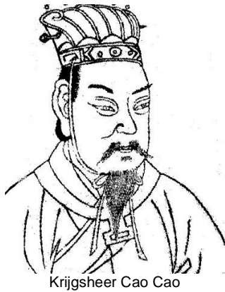
Krijgshoer Cao Cao