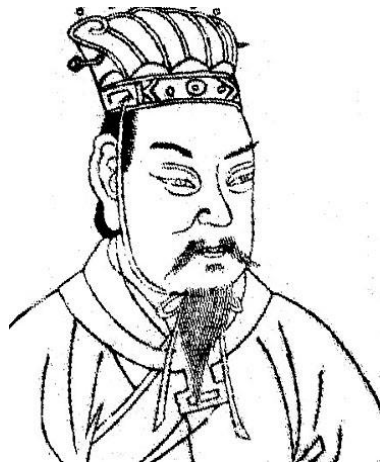
Krijgsheer Cao Cao

Van het centrale gezag van de Han-keizers is weinig meer over. Daardoor zijn reizigers hun geld en leven niet meer zeker.