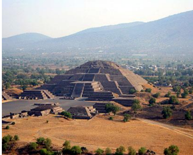
Piramide van de Zon in Teotihuacán (Mexico)

Aan de macht van de keizerlijke Han-familie die vier eeuwen achtereen China regeerde, lijkt een einde te komen.