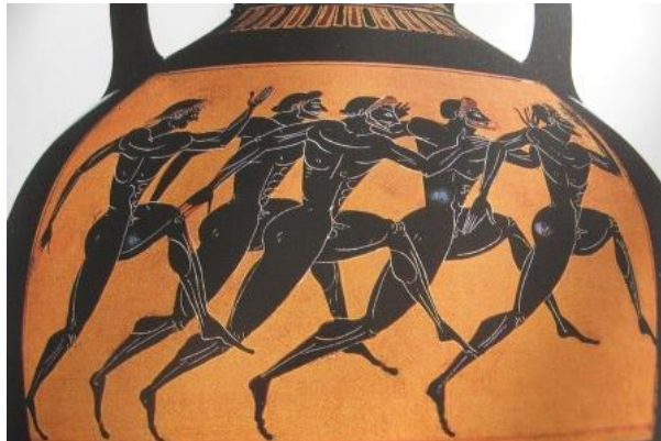
Olympische atleten op een Griekse vaas afgebeeld.