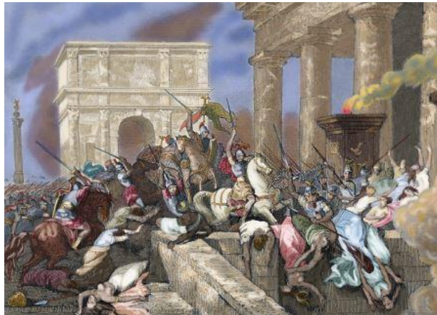
De Visigoten vallen Rome binnen en plunderen de stad.

Weer laat Alarik van zich spreken. Wat een kanjer! (zeg ik als Frankisch strijder)