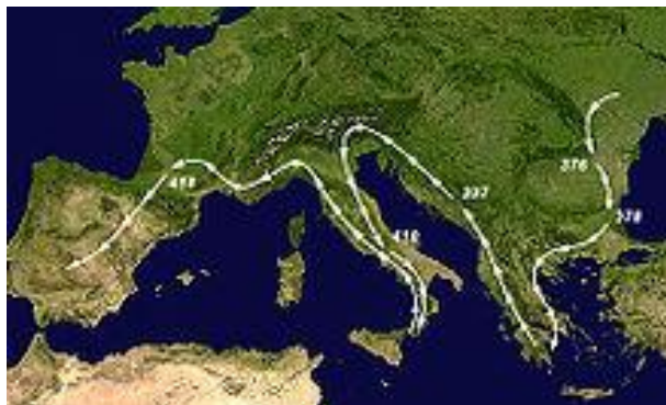
Zo trokken de Visigoten van oost naar west door Europa