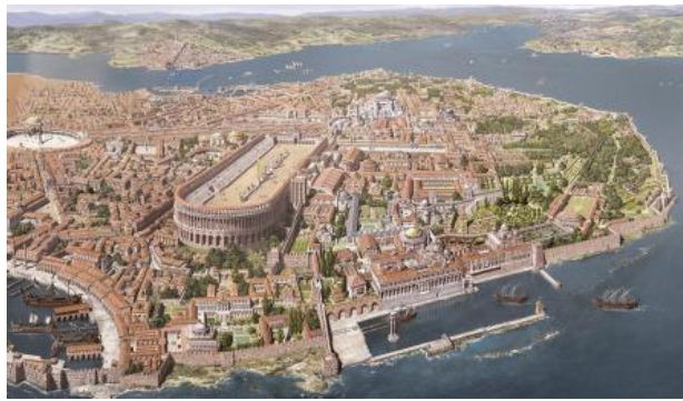
Is Nova Roma geen plaatje?!

Opnieuw een verrassing. Ik vraag me wel af of de elite van Rome daar nu zo blij mee is.