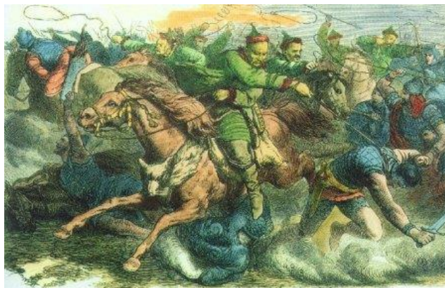
De Hunnen zaaien dood en verderf.