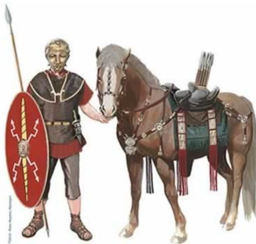
Aan z'n ronde schild kun je zien dat deze soldaat tot de zogeheten hulptroepen behoort. Romeinse legionairs hebben namelijk een rechthoekig schild.

Wil je het echt weten? Vanaf nu geef ik geen cent meer voor het West-Romeinse Rijk. Koning Alarik van de Visigoten denkt er net zo over en grijpt zijn kans.