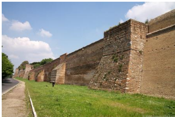
De stadsmuur van Rome.