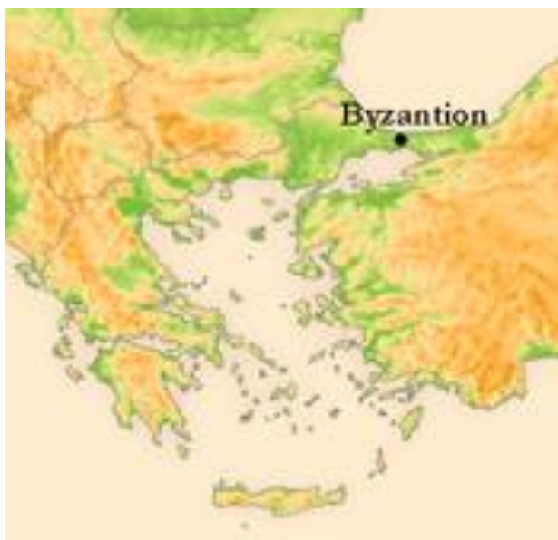
Toen heette het Byzantion, later Nova Roma, nog later Constantinopel en nu Istanbul

Die Constantijn... Hij blijft wel verrassen!