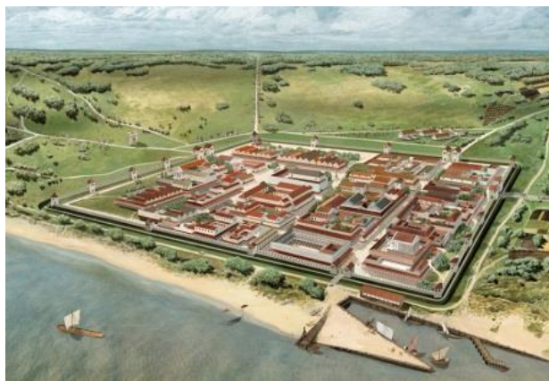
Nijmegen in de Romeinse tijd. Alle Romeinse steden lijken op elkaar: rechte straten, vierkante woonblokken.

Lekkere jongen die Probus! Hij is vast vergeten dat mijn voorvaders in 263 zijn voorganger nog uit de brand hebben geholpen!