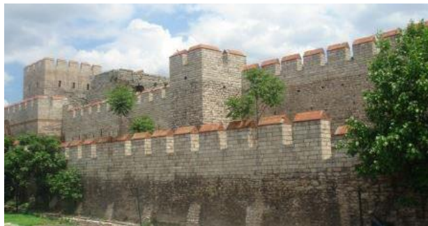
Restant van de muur van Constantinopel.

Na zes jaar keihard werken is het dan zo ver. Ik heb me laten vertellen dat de stadsmuren onvoorstelbaar dik en sterk zijn. Daar zullen belegeraars nog een flinke kluit aan krijgen!