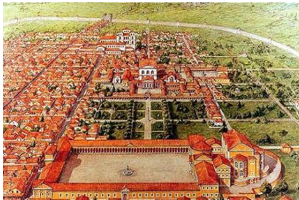
De Duitse stad Trier in de Romeinse tijd: rechte straten, kolossale gebouwen met op de voorgrond het openbare badhuis.

Het rommelt in het noordelijke grensgebied van het Romeinse Rijk. Franken (mijn voorvaders!) steken de grens over om te plunderen en brand te stichten. Bewoners voelen zich niet meer veilig.