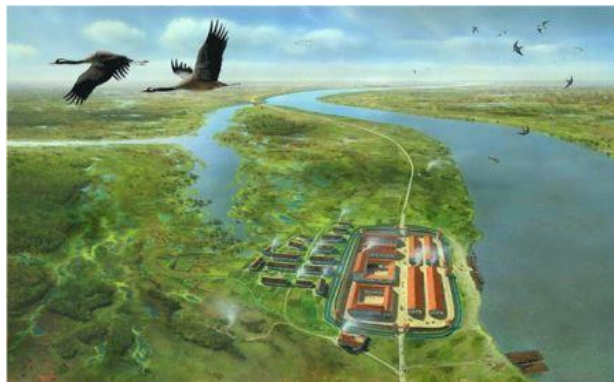
Een van de Romeinse forten langs de grens (limes).

Was hij nou 'fout' of 'goed' in de oorlog? In jouw tijd is dat misschien een belangrijke vraag. In mijn tijd gaat het er om: 'Wat levert het op?'