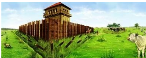
Dit is een van die wachtposten waarmee de keizer de rust in het noorden van zijn rijk probeert te herstellen.