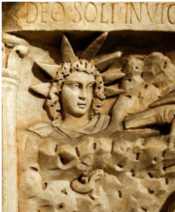
Afbeelding van de zonnegod Sol Invictis