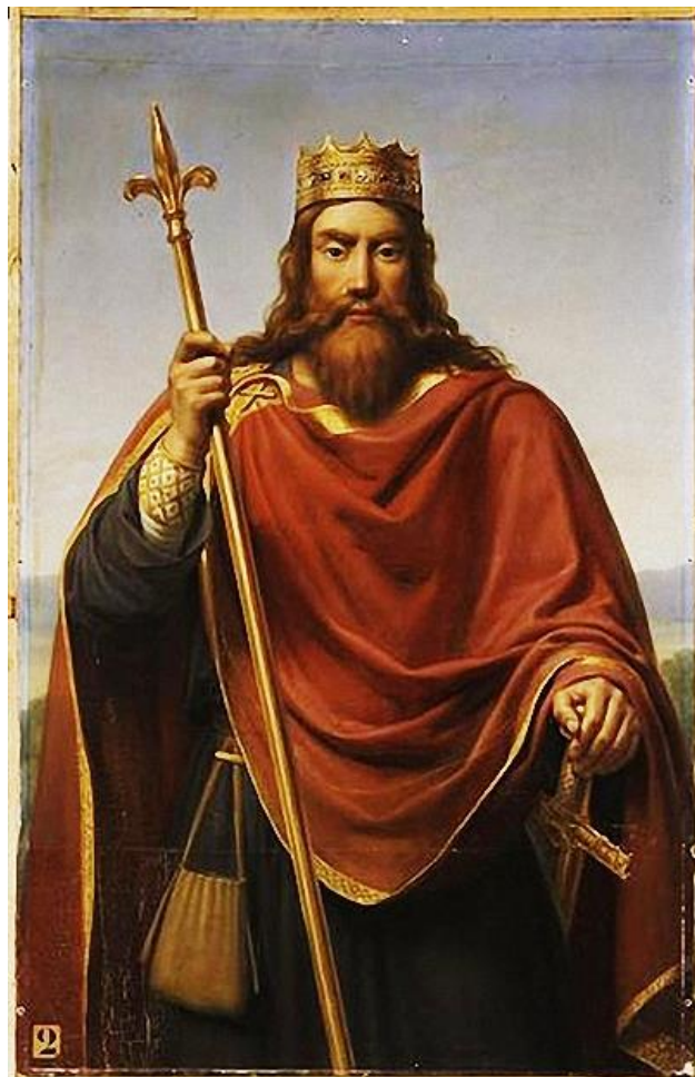
Clovis, koning der Franken (465-511)