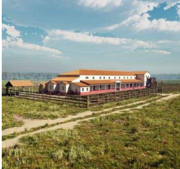
Een van die prachtige villa's die verlaten is. Dan moet er toch echt iets aan de hand zijn, anders doe je dat niet!