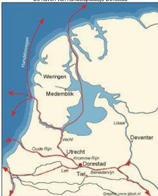
Dorestad lag op een strategische plek