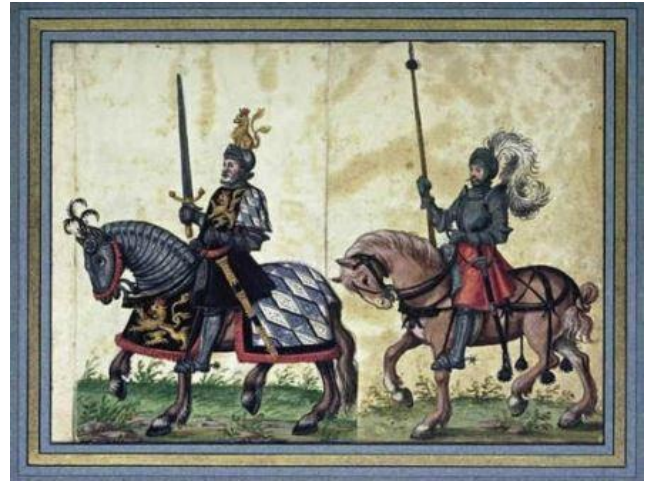
Stijgbeugel heeft invloed op de oorlogvoering

In de Middeleeuwen kun je er maar beter voor zorgen niet ziek te worden. Veel kinderen sterven in hun eerste levensjaar aan wat we nu 'onschuldige' ziekten noemen. Medische kennis komt niet boven het niveau van hocus-pocus. Dus als de 'zwarte dood' aan de deur klopt, zijn de rapen gaar.