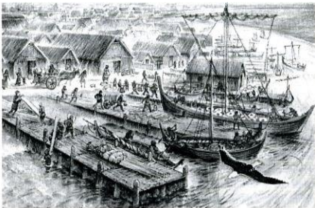
De haven van handelsplaatsje Dorestad