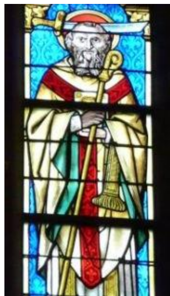
De heilige Theodardus van Maastricht