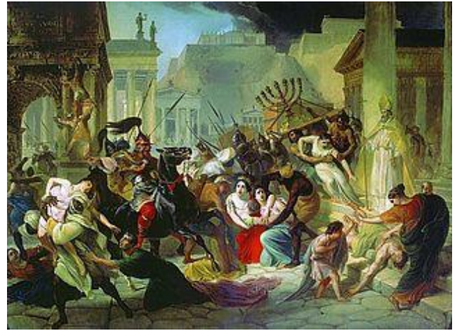
Barbaren plunderen Rome