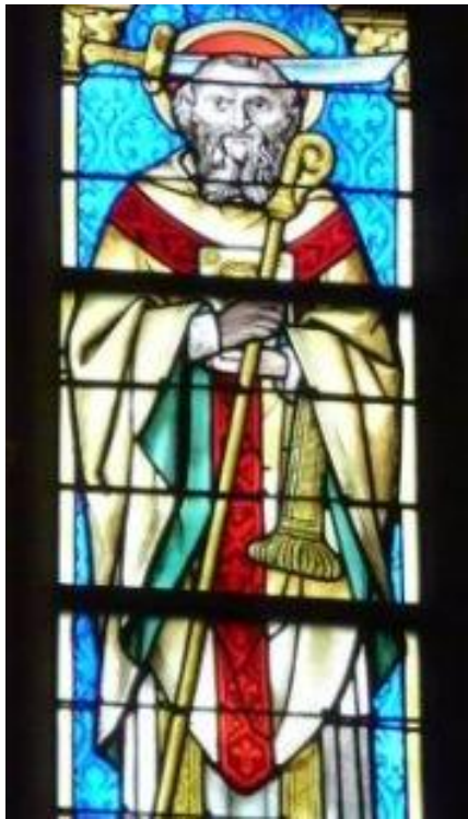
De heilige Theodardus van Maastricht