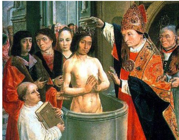
Doop van Clovis

man. Hij slaat zijn slag in het gebied dat de Romeinen Gallië noemden en later de naam van zijn veroveraar kreeg: Frankrijk.