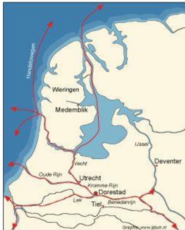
Dorestad lag op een strategische plek