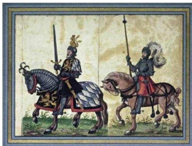
Stijgbeugel heeft invloed op de oorlogvoering

In de Middeleeuwen kun je er maar beter voor zorgen niet ziek te worden. Veel kinderen sterven in hun eerste levensjaar aan wat we nu 'onschuldige' ziekten noemen. Medische kennis komt niet boven het niveau van hocus-pocus. Dus als de 'zwarte dood' aan de deur klopt, zijn de rapen gaar.