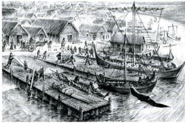
De haven van handelsplaatsje Dorestad