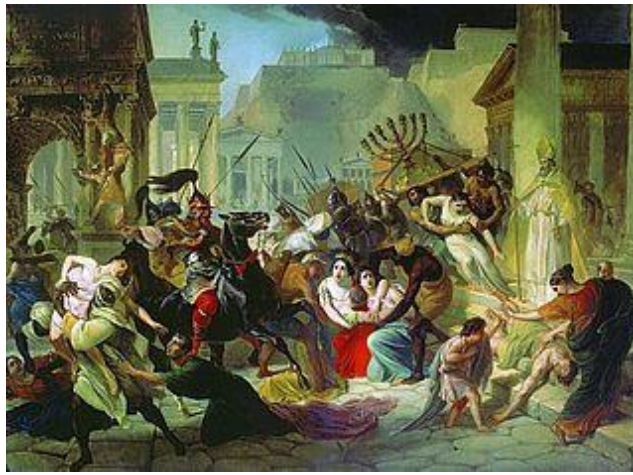
Barbaren plunderen Rome