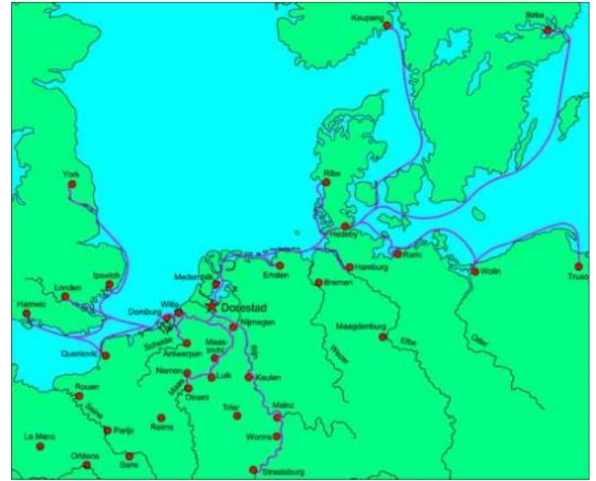
De blauwe lijnen zijn handelsroutes van en naar Dorestad (Dorestad onthuld)