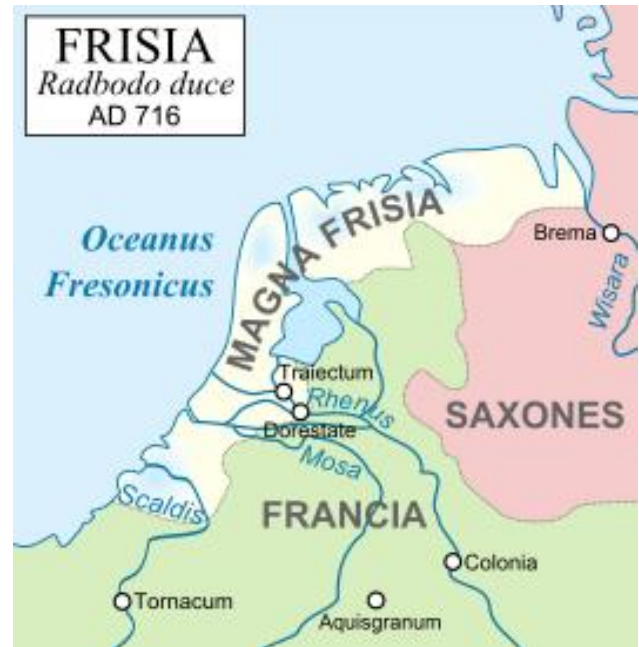
De inwoners van Dorestad zijn Friezen (Wikipedia)

een drukke boel was. Een beetje te vergelijken met het Rotterdam van nu. Dorestad was namelijk de grootste havenstad van noordwest Europa: veel handel en internationaal georiënteerd. Okay, Dorestad telde maar een paar duizend inwoners, maar vergeleken met Utrecht (400 inwoners) en Amsterdam (moerasgebied) alleszins respectabel voor die tijd.