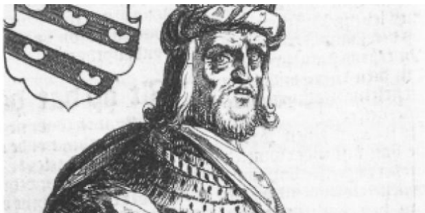
Radboud, koning der Friezen (679-719)

Ken je een vergelijkbare situatie in onze tijd?