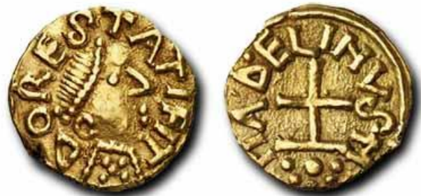
DORESTAT FIT = in Dorestad geslagen (Dorestad onthuld)

De handel kende ook in deze tijd geen grenzen! Een jaar later trekken de Friezen zich uit Dorestad terug. Hoe kwam dat zo? (zie voor een antwoord 689-N1 )