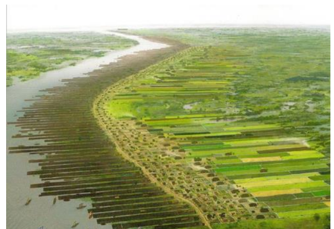
Aanlegsteigers langs de oever van de Kromme Rijn (Pinterest)

Waaruit is uit op te maken dat Dorestad enige allure had?