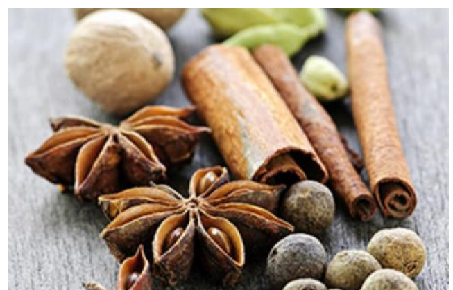
Oosterse kruiden

Tijdens het eerste deel van de wandeling wordt bij vrij veel jaarpaltes even stil gestaan. Maar na jaar 700 loop je met zevenmijlslaarzen door de geschiedenis.