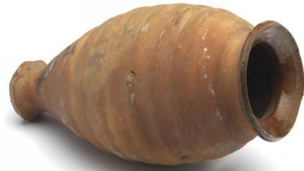
Wijnamfoor (Museum Boijmans)

We weten niet precies hoe het was om vrouw te zijn in Dorestad. In China hadden ze daar in elk geval uitgesproken ideeën over (zie 694-W ). Waar kom je die opvattingen vandaag de dag nog tegen?