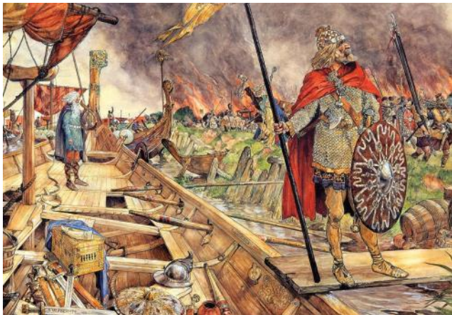
De Noormannen voor Dorestad'. Schoolplaat van J.H. Isings (1927)