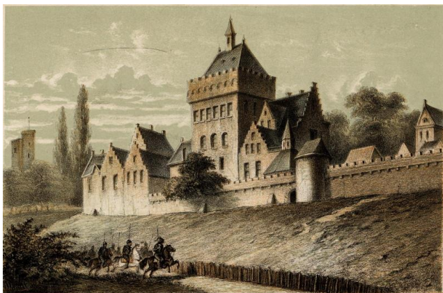
Valkhof – Nijmegen (Atlasenkaart)

Ooit kwamen Scandinavische handelaren naar Dorestad om handel te drijven. Nu vooral om te plunderen. Hoe zou dat komen?