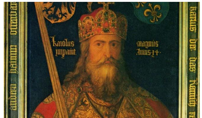
Karel de Grote (742 of 743 – 814)