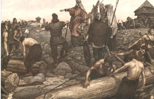
Slavenhandel van de Vikingen (Historiek)

En je kunt er ook op schaatsen! Wat is jouw mooiste schaatsherinnering?